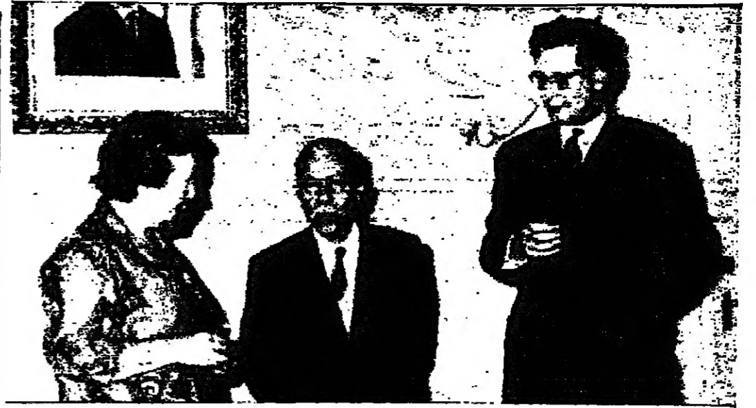
السيد احمد طوقان نائب رئيس الوزراء اثناء استقباله القنصلية البريطانية في لندن ( تصوير: ا. ا. )